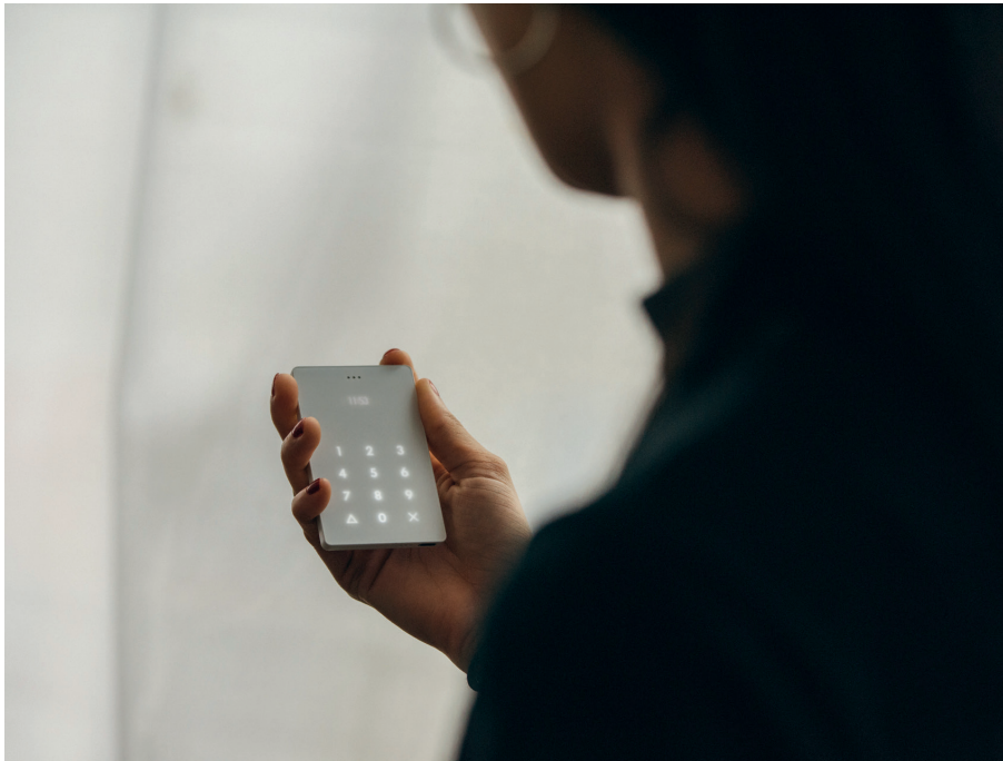
Figure 1 : Light Phone d'origine

Le Light Phone a été conçu pour être utilisé en plus du smartphone, et non pas pour le remplacer. En effet, il ne permet pas de se connecter à l'Internet. Il permet ainsi à son utilisateur de laisser son smartphone chez lui et de se « déconnecter », tout en gardant sur lui un appareil de télécommunication.