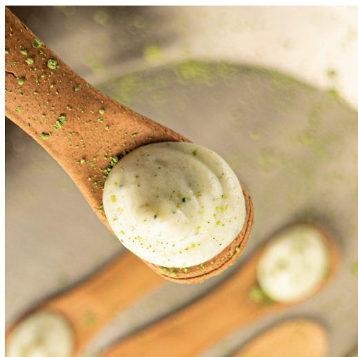
Figure 7 : Couverts comestibles de Futuretensils

(Suite de la question à la page suivante)